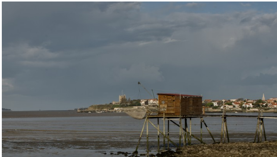
Carrelet typique de la Charente-Maritime. Au fond, le fort Vauban

Situées en Charente-Maritime, à mi-chemin entre La Rochelle et Rochefort, Fouras et sa presqu'île nous offrent un panorama exceptionnel sur l'estuaire de la Charente et les pertuis charentais.