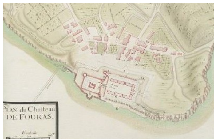
Carte ancienne. Date et origine indéterminées

De 1689 à 1693, l'ingénieur François Ferry mène une grande campagne de travaux pour permettre au fort d'assurer pleinement sa charge défensive. Il fait épaisir les murs et crée une fausse braie (sorte de douve sans eau), permettant 3 niveaux de feu. 9 canons sont ainsi positionnés sur la terrasse du donjon, dominant l'estuaire à plus de 36 mètres de hauteur.