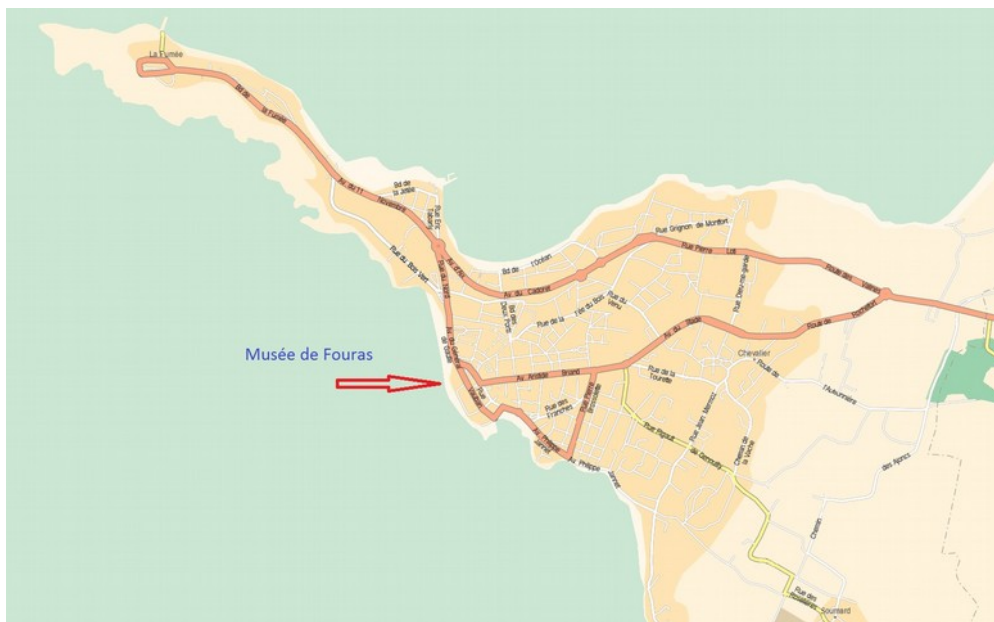
Le Musée au coeur de la presqu'île

Musée régional de Fouras - BP 70 026 17450 Fouras - 05 46 84 15 23 – accueil.musee@fouras.net