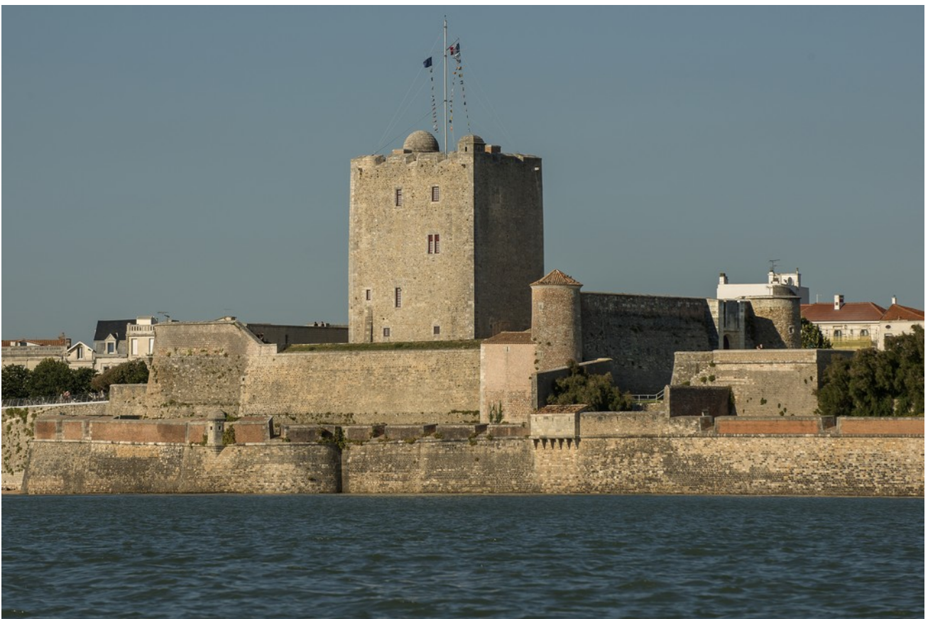
Le fort Vauban vu depuis la mer